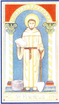
Schutzpatron der Koloproktologen