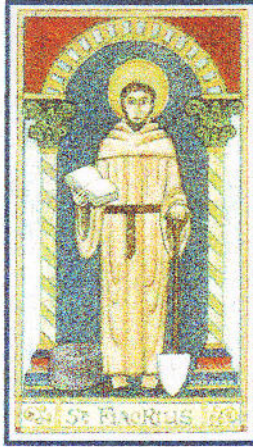
Schutzpatron der Koloproktologen